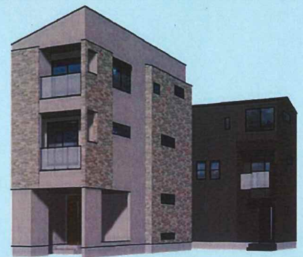
パースは図面を元に描き起こしたもので実際とは多少異なります